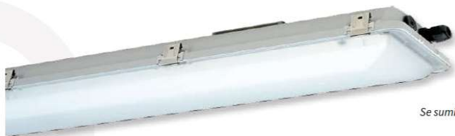
Se suministra sin soportes de montaje.